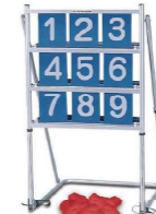
ストライクボード